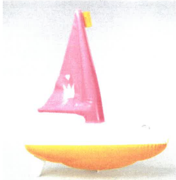
HS 240242_2 LODIČKA Princezna