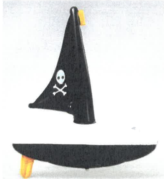
HS 240242_1 LODIČKA Piráti

Podniková norma PND 5-498-2010 ML 20, vydání č. 4