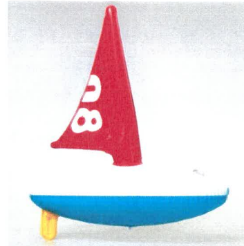
HS 240242_3 LODIČKA Regata