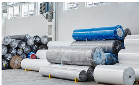
Folie in Rollen

Wir kaufen PP, PE, PP/PE und EVAC-Materialien in allen gezeigten Formen auf: