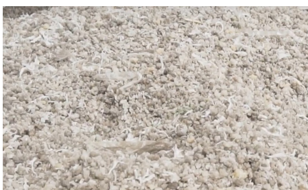
Zerkleinerte Materialien, Agglomerate