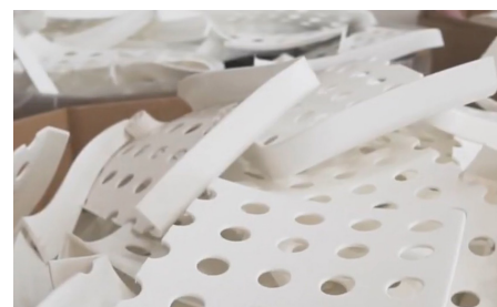
Nicht übereinstimmende Teile

Die Anlage für Sammeln, Ankauf und Nutzung von Kunststoffabfällen ist im Register der Institutionen des Umweltministeriums MŽP eingetragen, unter der Nummer der Betriebsstätte: Id-Nr.ZZ00744.