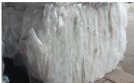
Folien in Paketen gepresst