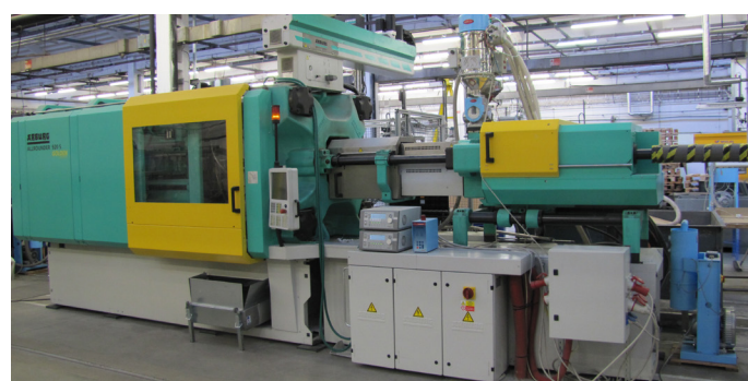
ARBURG, Schließkraft 4 600 kN