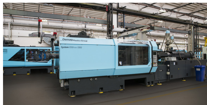
DEMAG, Schließkraft 4 200 – 6 500 kN

Für weitere Informationen oder ein konkretes Angebot können Sie sich gerne an uns wenden.