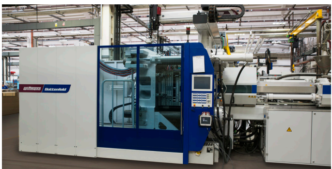
BATTENFELD, Schließkraft 6 000 – 8 000 kN